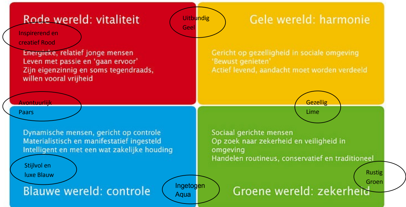
Figuur : De basis voor het leefstijlonderzoek: het BSR model.

Op basis van het leefstijlen onderzoek worden diverse type recreanten onderscheiden.